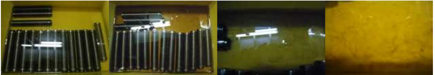
前洗浄 特殊洗浄液使用

株式会社サンウイル TEL:06-6452-2248 FAX:06-6452-2218