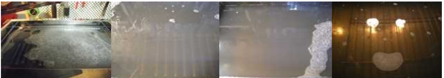
超音波洗浄 25分間:1回目 カーボン落とし特殊洗浄液使用