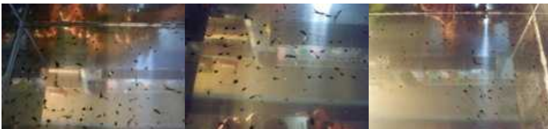
沈殿したカーボン汚れ