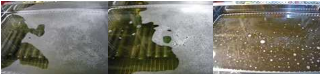
超音波洗浄 25分間:1回目 目詰り汚れ用洗浄液使用