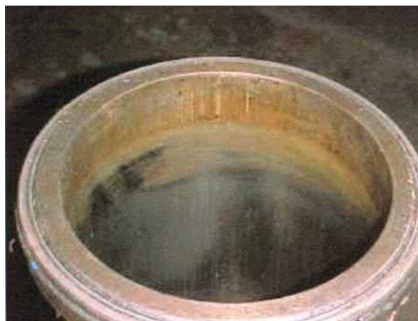
Before - inside 修正前、内面