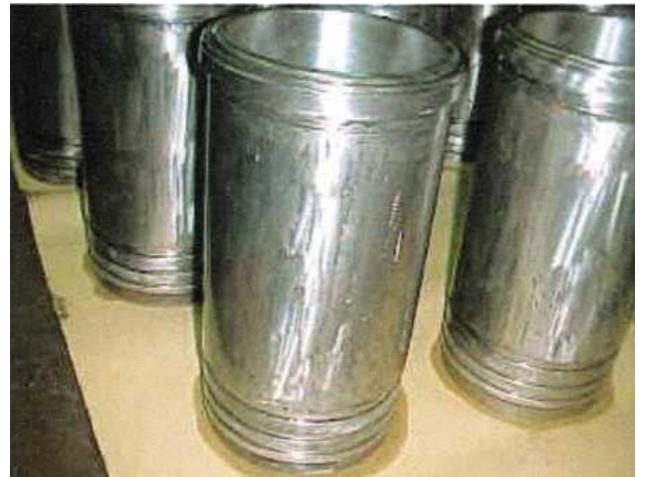
After Cleaning up 清掃洗净後