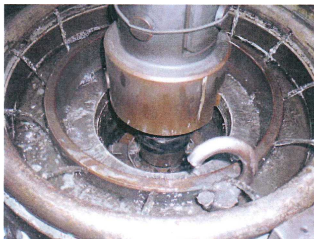
Processing Honing ホーニング加工