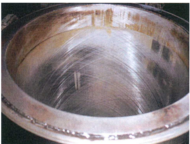
Under Processing Honing ホーニング途中