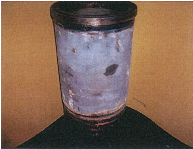
Before Cleaning up 清掃洗净前