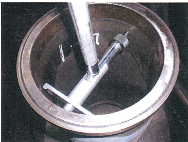
Measurement of Inner Diameter 内径計測