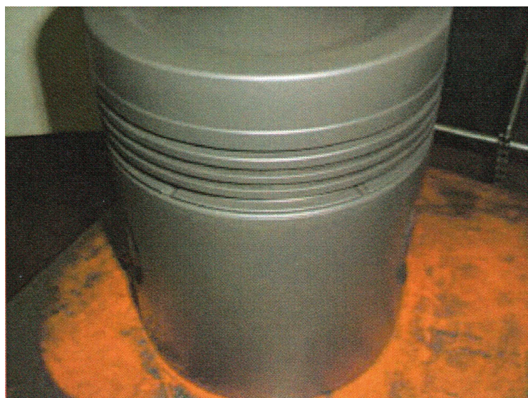
デフレックコーティング加工 Defric coating