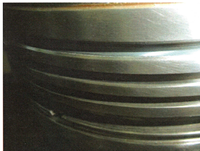
リング溝修正後 溝キ加工 After recondition. Cr plating ring